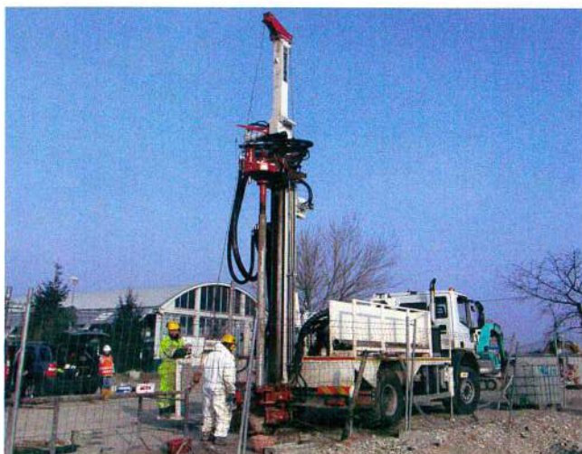
Indagini ambientali a Parma con perforatrice modello MI8.

Ogni anno Massenza prosegue nel suo percorso evolutivo e progetta nuove soluzioni dettate dalle specifiche richieste dei suoi clienti. Il 2015 è stato l'anno dell'inaugurazione del nuovo modello MI3, già venduto in Gran Bretagna e Olanda: la perforatrice può essere equipaggiata con diverse teste di rotazione con un range di coppia e velocità rispettivamente fino a 800 kgm e 714 RPM. Il tiro standard è di 3.100 kg, ma con la torre opzionale si possono raggiungere i 4.000 kg. La MI3 si distingue per le dimensioni ridotte e il peso contenuto (2.600 kg) che consentono di caricarla su un piccolo semi-trailer secondo le normative vigenti.