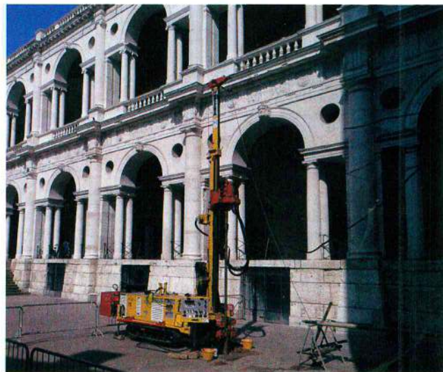
MI4 impegnata in sondaggi nel centro storico di Vicenza.

Nel 2014 Massenza ha inaugurato anche il settore fondazioni e consolidamenti con la perforatrice modello MM4, venduta già in Francia e Gran Bretagna.