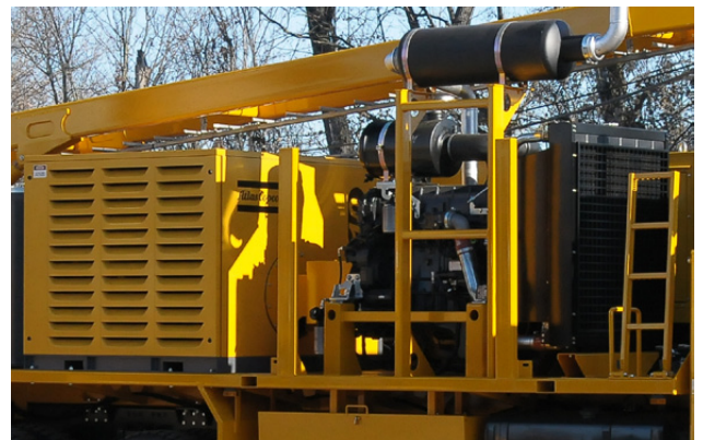
Compresore d'aria Air compressor Compresseur d'aire Kompressor Compresor de aire