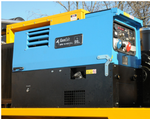
Saldatrice Welding machine Soudeuse Schweißer Soldadora