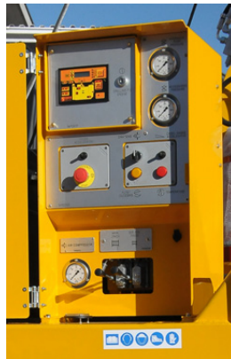
Pannello comandi Control panel Panneau de commande Bedienstand Panel de control