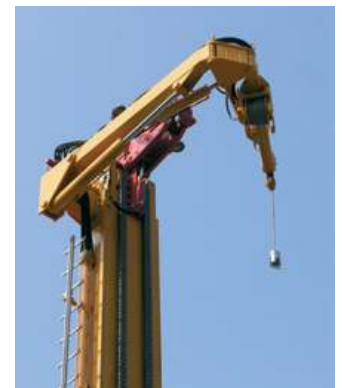
Caricatore aste Pipe loader Chargeur de tiges Bohrgestänge-lader Cargador de barras Автопогрузчик штанг

Specifiche tecniche soggette a cambiamenti senza preavviso / Technical specifications are subject to changes without previous notice / Especificaciones técnicas sujetas a cambio sin preaviso / Dimensions et caractéristiques sujettes à changement sans préavis / Technische Änderungen vorbehalten. Sonderanfragen richten Sie bitte an unser technisches Büro / Технические характеристики могут быть изменены без предварительного уведомления