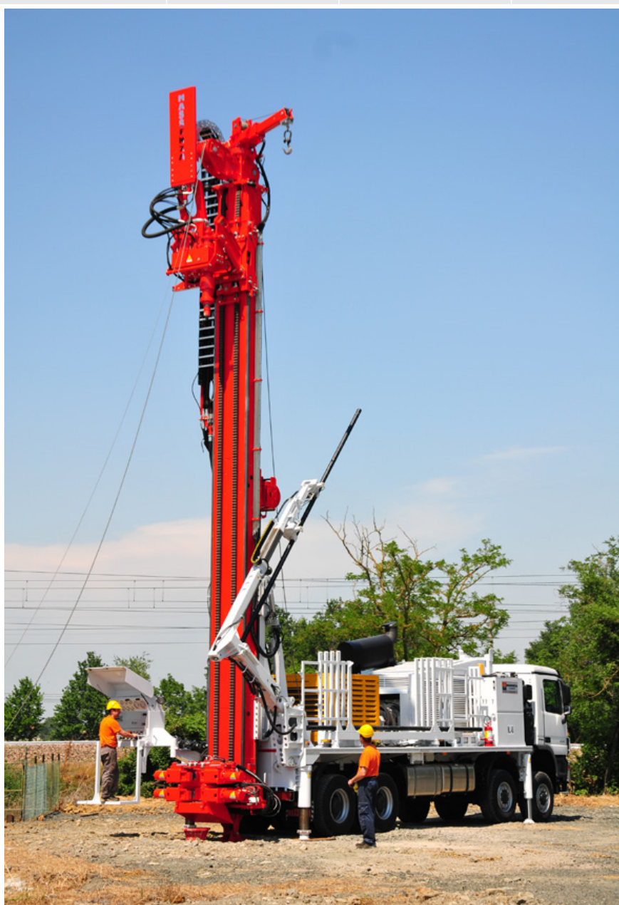
Caricatore aste con braccio Pipe loader with arm Chargeur de tiges avec bras Bohrgestänge-lader mit arm Cargador de barras con brazo Манипулятор подачи штанг